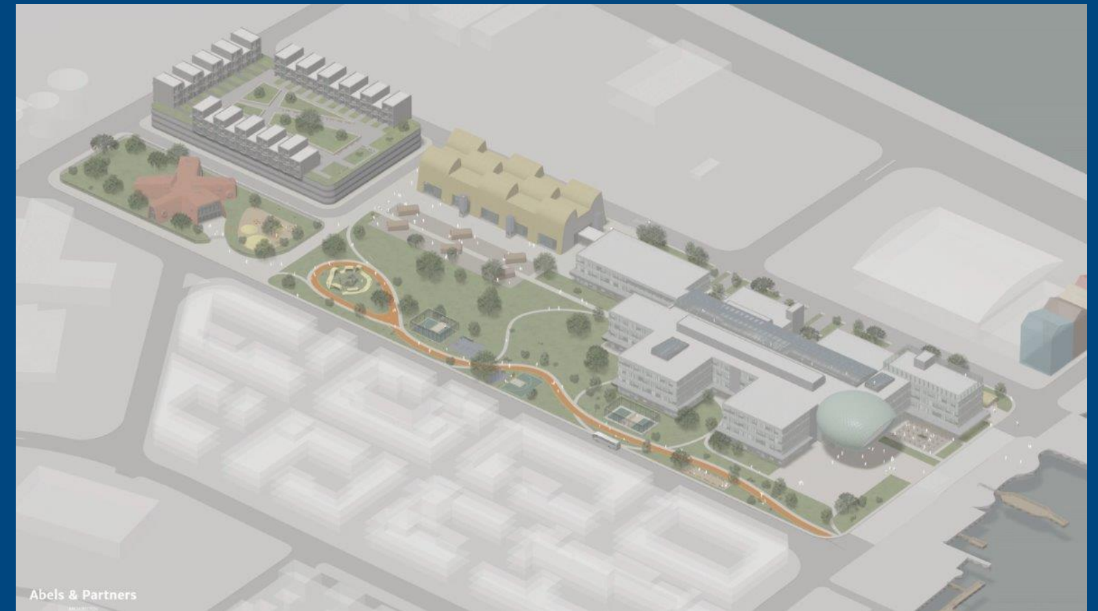
30.000 fermetrar undir sama þaki

https://youtu.be/1zmMzJuuK1s?list=PL8VU08du