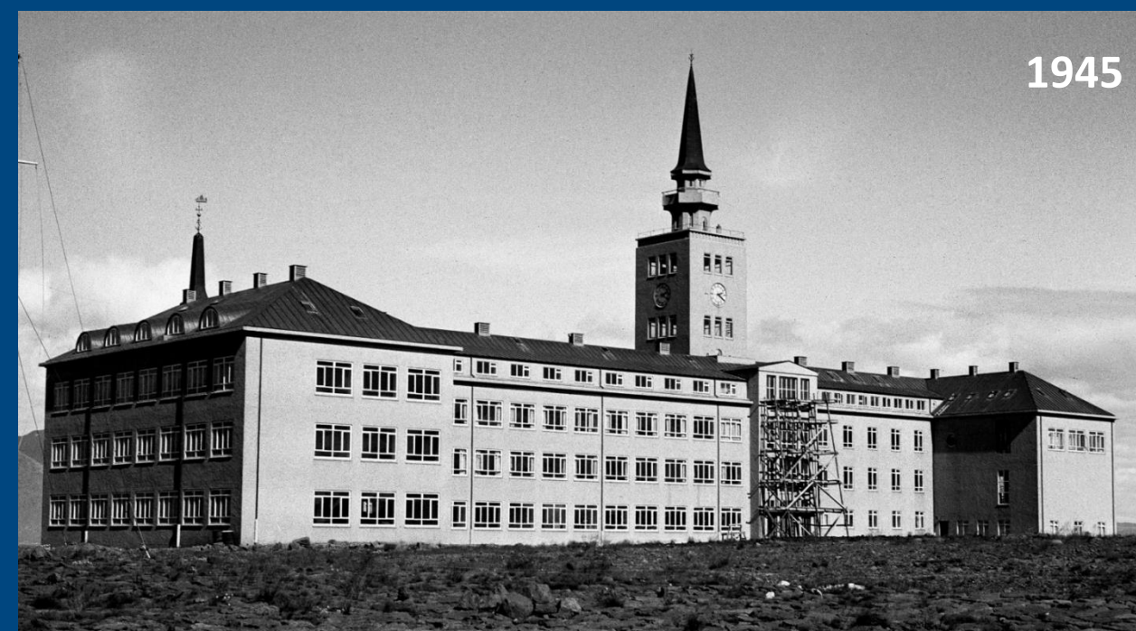
Stýrimannaskólinn + Vélskólinn = Fjöltækniskólinn 2003 Tækniskólinn 2008