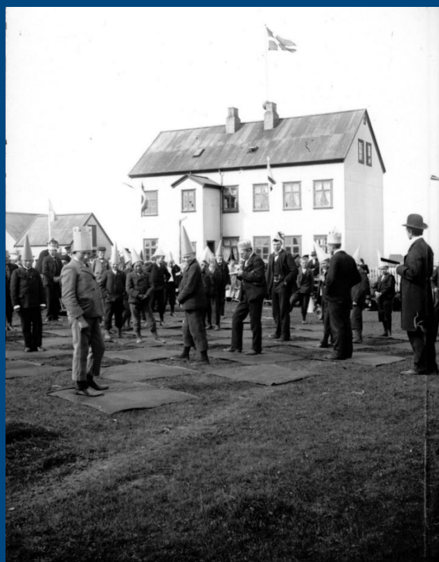
Stýrimannaskólinn í Reykjavík 1891