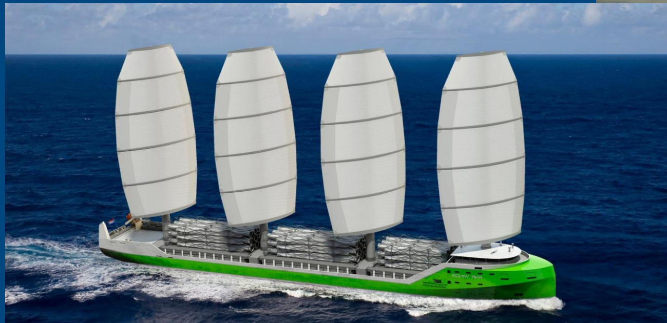
Illustration: A.P. Møller - Mærsk.

I 2024 skal de første nye containerskibe med metanolmotorer sættes i søen. Se de første billeder af ny-designet containerskib med kurs mod klimaneutralitet.