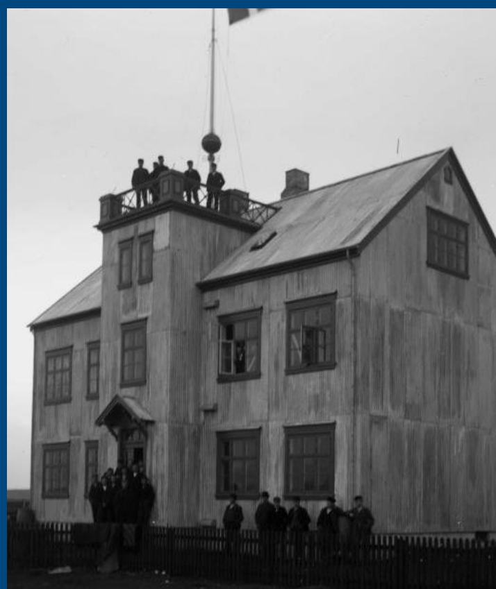
Vélskóli Íslands 1915