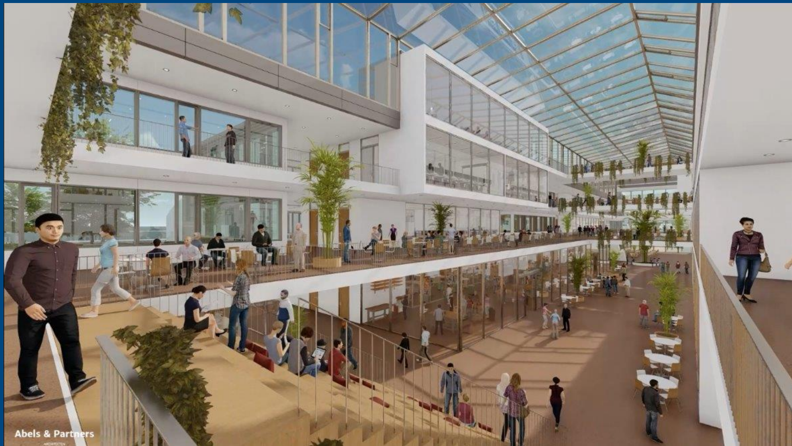
Bylting í skólastarfi