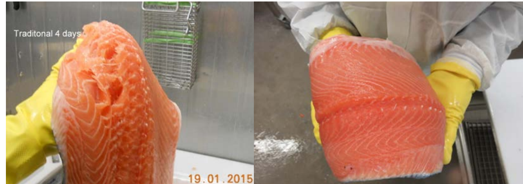
Samanburður á gæðum á laxaflökum, hefðbundin vinstramegin og ofurkæld hægra megin