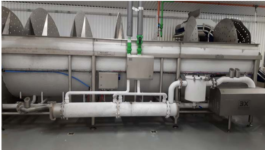
Rotex búnaður hjá Arnarlaxi á Bíldudal